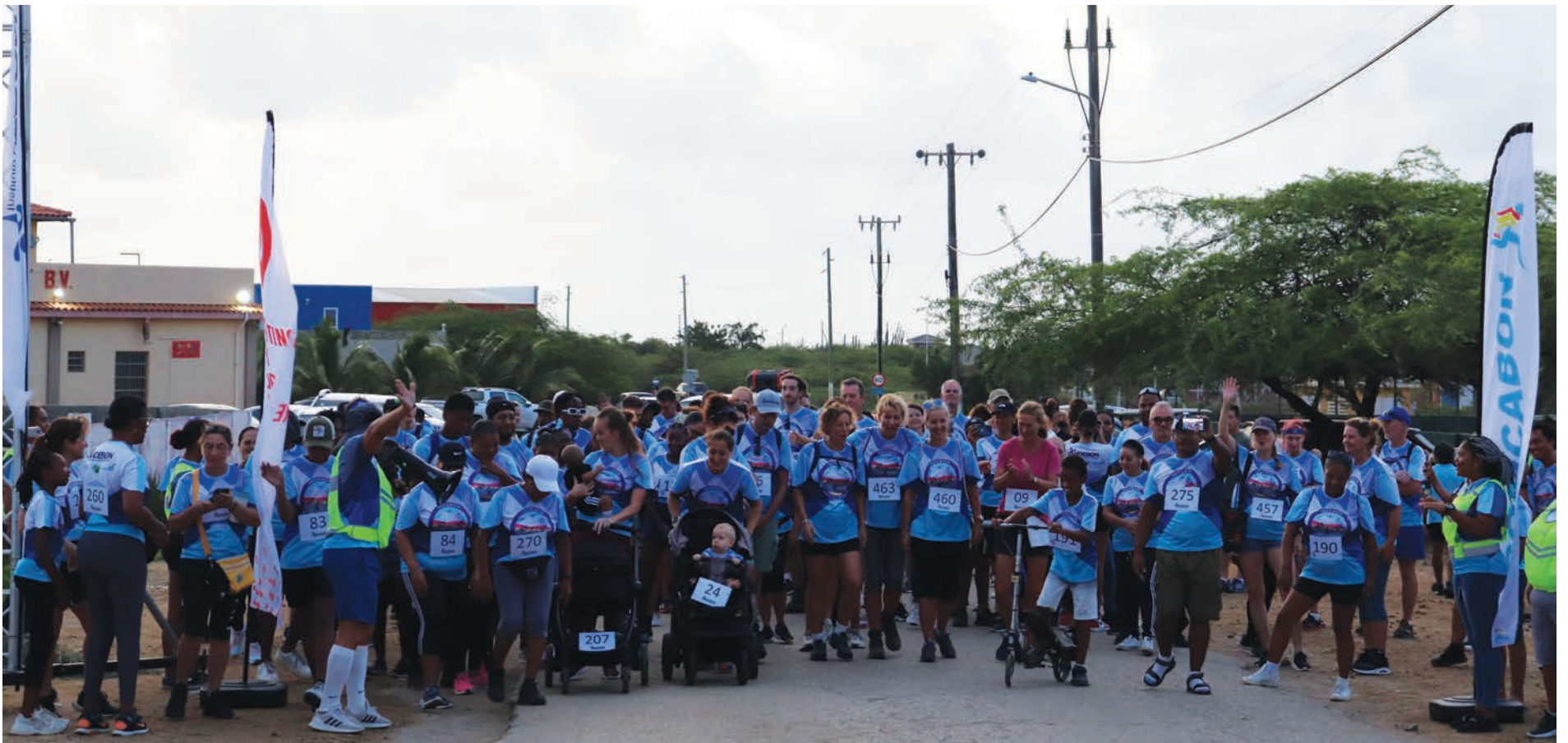
E kareda a kuminsá alrededor di mitar di shete di mainta na Jossy Boekhoudt Ballpark i a terminá na Ocean Oasis. Un kantidat grandi di hende a partisipá na pia i riba baiskel. E ánimo i energia di e partisipantenan tabata haltu.

INDEBON por mira bèk riba un eksitoso Kareda di Suit